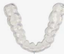
49 min 8 Schienen