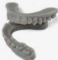
9 min 11 Aligner-Modelle