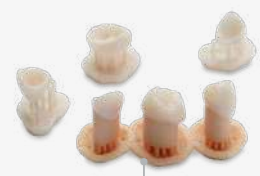
18 min Mehr als 100 Kronen

Vereinfachte Zahnmedizin durch innovative Lösungen.